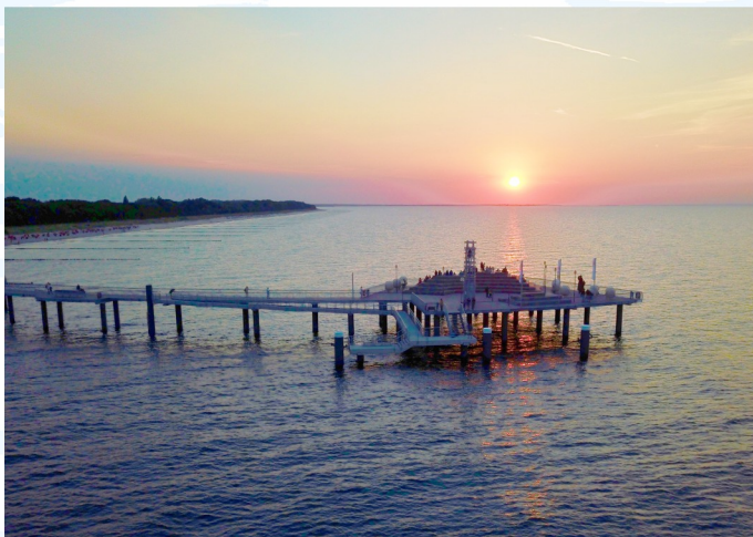
Layout: Werbeservice Adrion, 17454 Zinnowitz, www.werbeservice-adrion.de